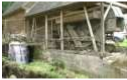
Apa si viata